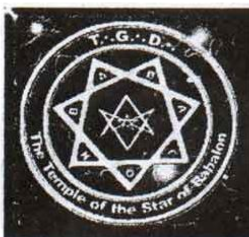
Gambar 6: Thelema

dunia. Oleh karena itu, segala macam dogma agama harus disingkirkan, sebab itu memenjarakan manusia: kebebasan, hawa nafsu, seks, dan segala keinginan manusia yang harus dinikmati, selama tidak mengganggu orang lain. Itulah sebabnya, ajaran setan ini mengakomodasi para lesbian, homoseksual, dan kebebasan seks.